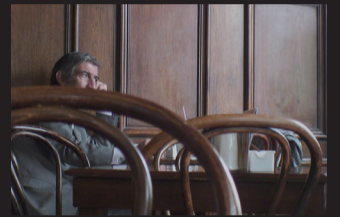
Tree of Forgetting