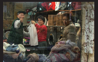
5 lessons and 9 questions about Chinatown