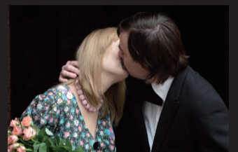
Nacht um Olympia