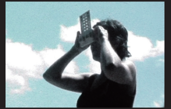
Cómo dibujar animales tristes...