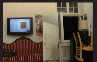
Film for Above the Sofa