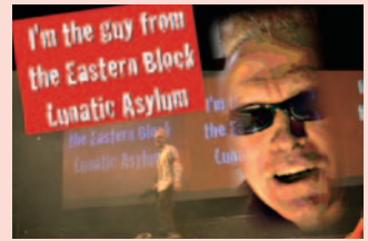
(The Never Ending) Operetta